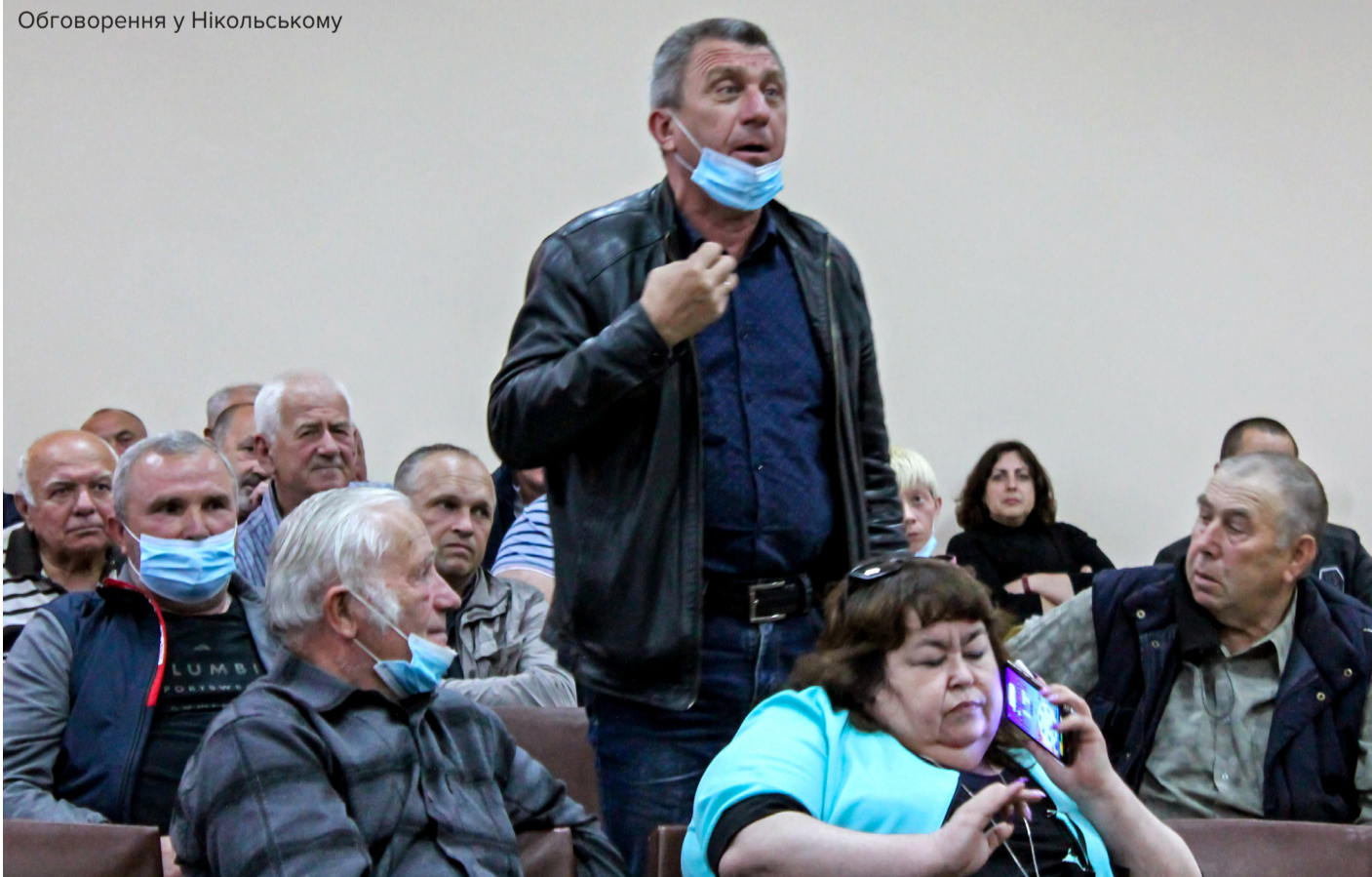
Обговорення у Нікольському

Сума податку, встановлена у Нікольському, не велика, всього 1% від вартості земельної ділянки. В грошовому вимірі це складає 300 гривень з одного гектара на рік. Пів мільйона гривень у бюджеті ОТГ сформовані саме з цих виплат. Це дає змогу використати їх на соціальні програми. У громаді збираються на ці гроші покращити стан доріг, зробити вуличне освітлення, забезпечити шкільне харчування, компенсувати