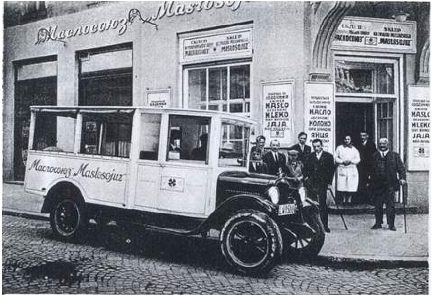
Одна з крамниць Маслосоюзу у Львові

Тож відволочемося від культової постаті Андрея Шептицького і сфокусуємося на показниках, які демонстрували українські кооперативи, аж поки їхня діяльність не була припинена вторгненням до Галичини Радянської влади та подальшою «націоналізацією» усіх економічних та інтелектуальних здобутків попередньої доби.