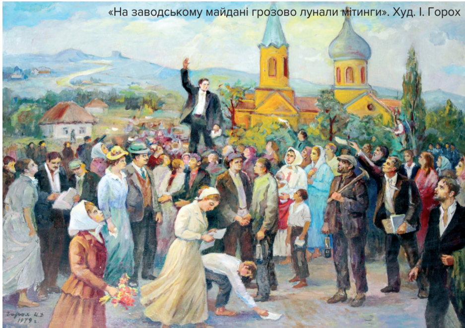
«На заводському майдані грозово лунали мітинги». Худ. І. Горох

У романі «Третя Рота» він описує це так: «Грудень 1918 року. Мобілізація. Мій рік має йти. Мати мене жене з дому: в мене вже й штанів немає. Я їй кажу: «Підождіть, ось уже недалеко червоні».