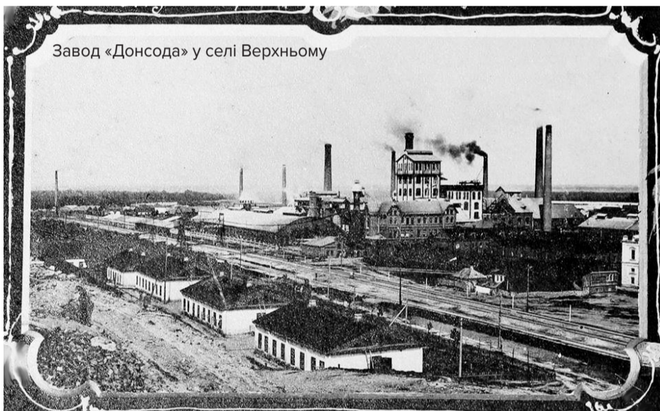
Завод «Донсода» у селі Верхньому