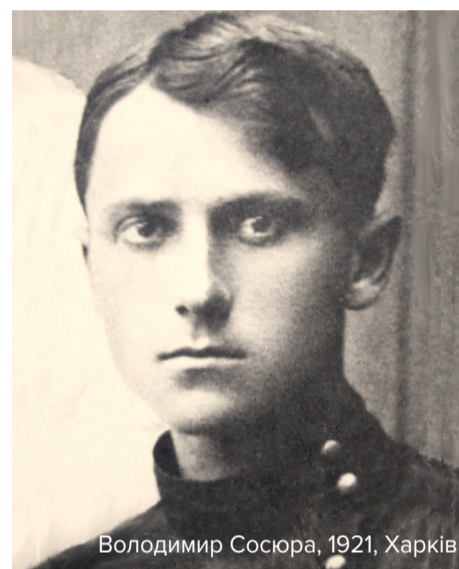
Володимир Сосюра, 1921, Харків

«А ще дужче я люблю свою Донеччину і Третю Роту», – писав Володимир Сосюра в автобіографічному романі-трилогії. Йшлося про село, територіально розташоване на Луганщині, проте поет узагальнив географію Донецьким краєм. У біографії Сосюра було багато такого, про що він не розповідав у своїх творах. Бо такий був час, що правда спричинила б вирок.