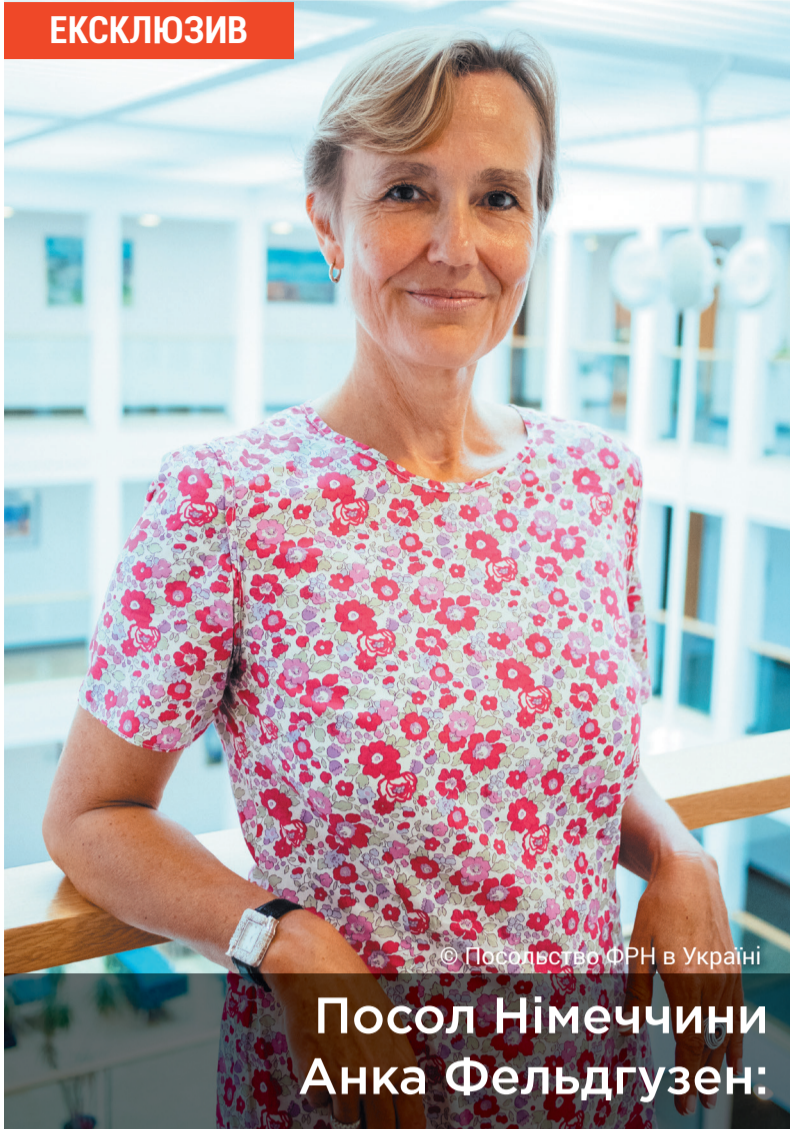
Посол Німеччини Анка Фельдгузен:

З липня 2019 року в Україні новий Надзвичайний і Повноважний Посол Федеративної Республіки Німеччина - пані Анка ФЕЛЬДГУЗЕН. Пані Посол не залишила без уваги запит нашої редакції і охоче розповіла читачам «Громади» про свої погляди щодо підтримки Сходу України і потенціалу нашої країни в цілому.