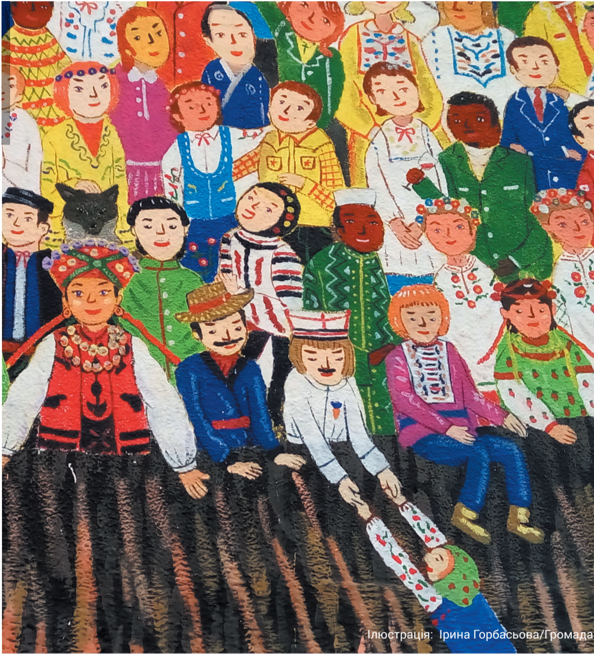
Ілюстрація: Ірина Горбасьова/Громада

Обсяги міжнародної допомоги вже нараховують сотні мільйонів доларів. Але є одне «але». З кожним роком скорочується видача так званої «гуманітарки» - на користь програм, що потребують самоорганізації та ініціативи безпосередньо від людей. Найбільші шанси на допомогу благодійників зрештою отримують ті, хто хоче допомогти собі сам.