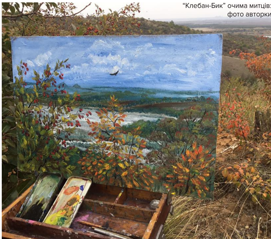
“Клебан-Бик” очима митців

Ще такий факт: через інтенсивність бойових дій кількість трав'яних пожеж в серпні 2014 року в Донецькій області була вдвічі більшою, ніж у сусідніх областях. Недивно, що флора і фауна Донеччини вздовж лінії зіткнення зазнала значних випробувань. Експерти фіксують непрогнозовані зміни у біорізноманітті: так, станом на 2017 рік зону полишили копитні тварини і птахи, з території національного парку «Меотида» зникли кучерявий пелікан, який там раніше гніздився, і найбільша в Європі колонія чорноголового крячок. Натомість на Сході України відбувається розселення нових для фауни регіону видів ссавців (шакали), риб (сонячний окунь), комах (гармонія азіатська) тощо. Через заміновані поля і неможливість збирання врожаю вздовж лінії зіткнення фіксується зростання популяції гризунів. Полювання в регіоні заборонене, тож спостерігалось також перенасичення популяції диких кабанів. На територіях Шахтарського, Амвросіївського районів та біля Маріуполя зростає щільність лисиць, в зоні бойових дій фіксуються випадки нападу вовків на домашніх тварин.