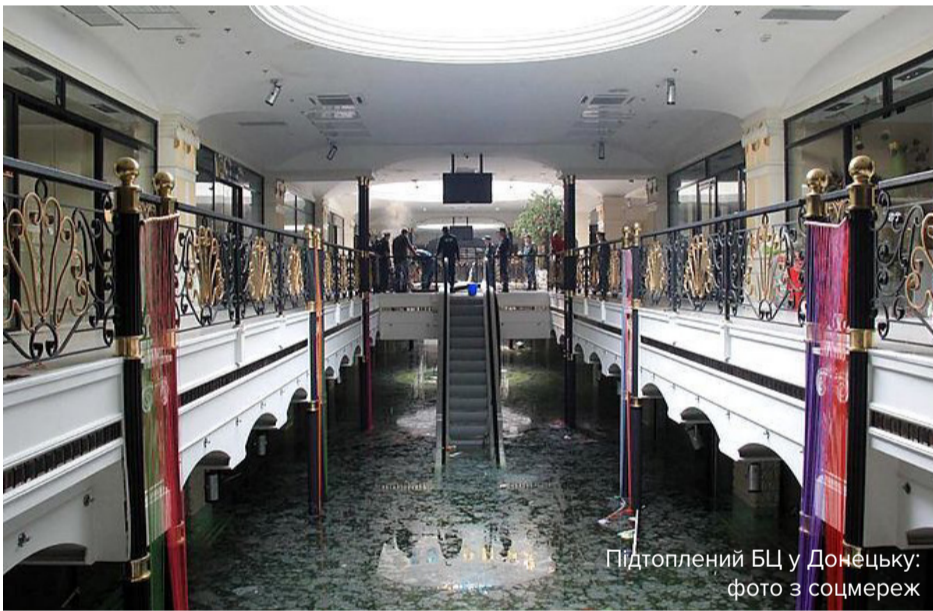
Підтоплений БЦ у Донецьку: фото з соцмереж

Результати досліджень показали також підвищені концентрації забруднюючих речовин у воді річок Сіверський Донець, Клебан-Бик, Кальміус і Кальчик. Як вважають експерти, значне (у порівнянні з даними 2008 року)